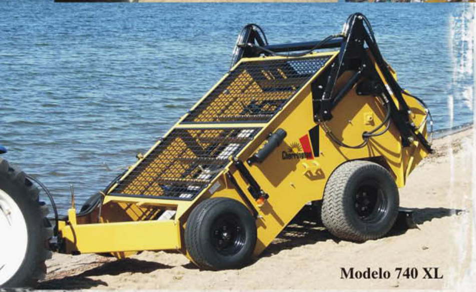
Modelo 740 XL

Los limpiaplayas/cribadores a potencia remolcables de la Serie 700 se cargan automáticamente y tienen un ancho de limpieza de 1.22 metros. La reja excavadora se introduce en la arena hasta una profundidad de 10 cm, recoge la arena y la lleva por medio de un transportador hasta las cribas oscilantes de cambio rápido donde se tamiza. La basura y las algas marinas se recogen en una tolva de .38 metros cúbicos. Se desocupa la tolva en el suelo o con el elevador de 1.52 de alto.