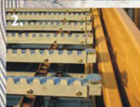
Modelo 4700 XL

¿Cuál sería el resultado si se recurriera a 25 años de experiencia y a un diseño orientado al consumidor para fabricar un limpiaplayas desde su principio? ¡El Modelo 4700 XL!