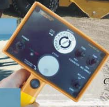
Control remoto inalámbrico 950